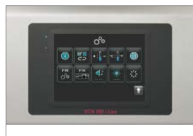
Особенно удобные в эксплуатации базовые программы, программы сервиса и контрольные программы