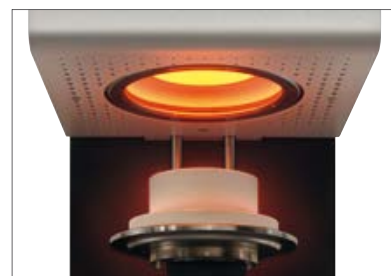
Превосходные результаты обжига